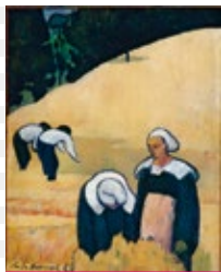
Emile Bernard - Die Weiserernte, 1888. Öl auf Leinwand 50,4 x 43,7 cm - Musée d'Orsay, Paris

In Zusammenarbeit mit der Kunsthalle Bremen