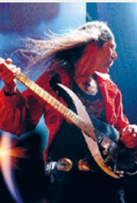
Uli Jon Roth (Ex-Scorpions)