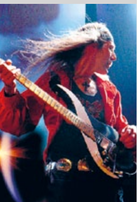
Uli Jon Roth (Ex-Scorpions)

Information und Anmeldung bis 15. August unter 0421-302242 oder musikdirektion@kulturkirche-bremen.de