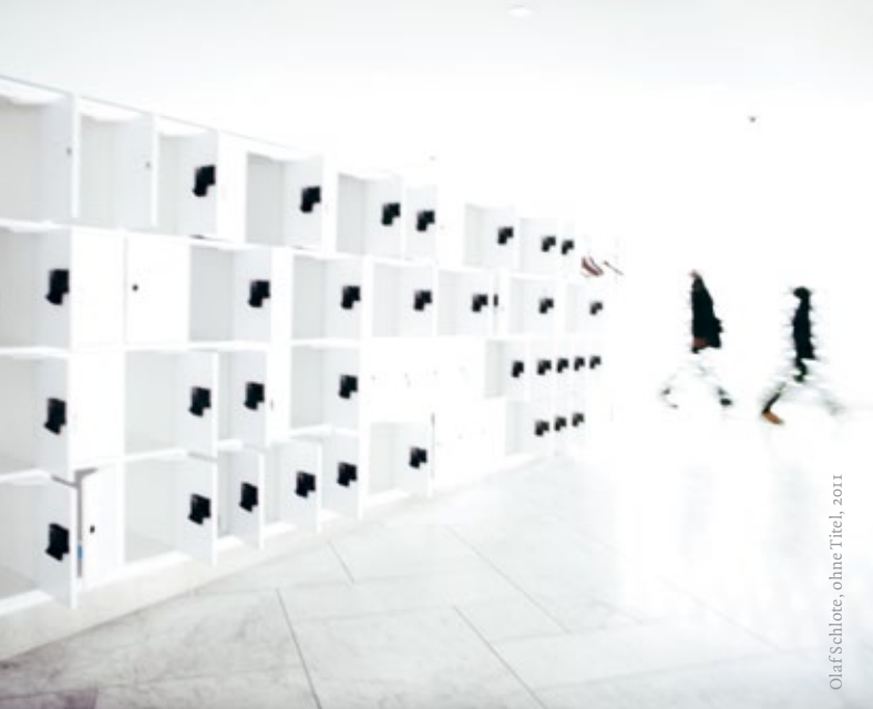
Olaf Schlote, ohne Titel, 2011