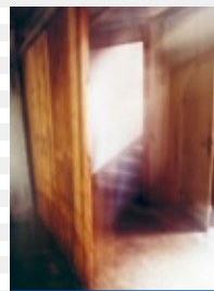
Olaf Schlote, ohne Titel, 2011