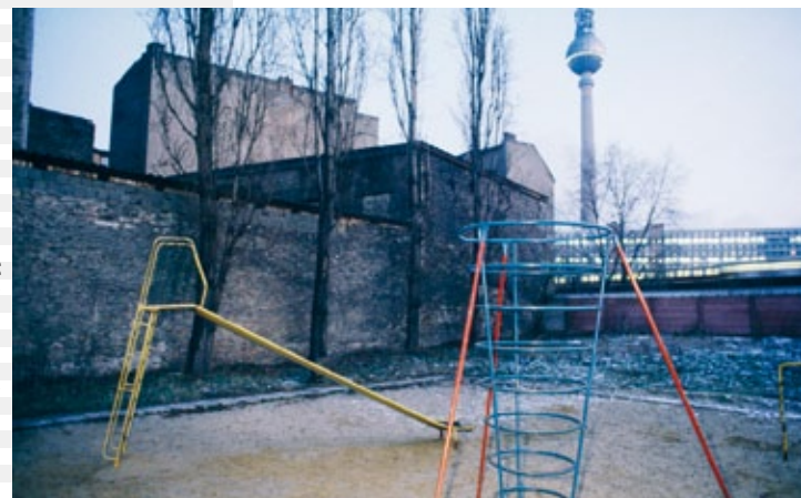
Olaf Schlote, Berlin, Mitte, 1992

Zur Ausstellung erscheint eine Erinnerungsmappe mit den Bildern der Ausstellung